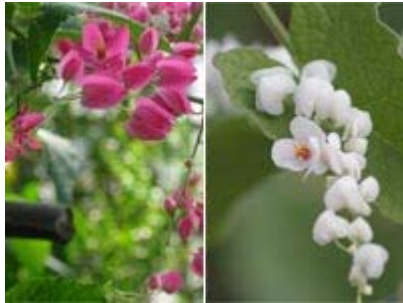
Hai loại ti gön hồng và trắng

Hai sắc hoa ty gön, huyền thoại lãng mạn gắn bó với Thâm Tâm, một trong những nhà thơ tài hoa mệnh yếu thời tiền chiến. TTKh hay Thâm Tâm là người đầu tiên sử dụng hai chữ "người ấy" và đem hình ảnh "hoa ty gön" vào trong thơ, như một hình tượng nghệ thuật mơ hồ và phiếm định về người tình và cuộc tình tan vỡ.