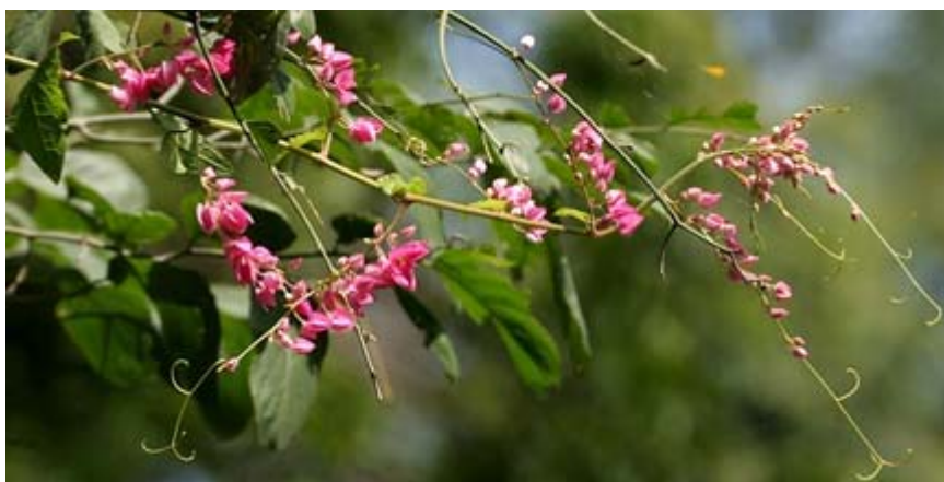
Hoa ti gôn hồng (antigonon leptopus)

Antigone là loại hoa của người Pháp đem qua hồi đầu thế kỷ, không thơm nhưng đẹp. Nó là loại hoa dây, lá giống như lá nho, cho nên ở miền Nam nhiều người gọi là hoa nho. Có hai loại: Hoa trắng và hoa hồng. Hoa nở vào đầu mùa Hè thành những chùm rất dễ thương, nụ hoa giống hình trái tim nho nhỏ. Ở Hà Nội người ta trồng rất nhiều và bán cũng rất nhiều ở Chợ Đồng Xuân, cũng như ở Chợ Hoa, bờ hồ Hoàn Kiếm. Cắm nó vào lọ để phòng khách, nó bung ra một vẻ lãng mạn, khả ái lắm. Người Bắc gọi tắt là hoa ty gôn. Ở phố Sinh Từ, antigone mọc rất nhiều, như trước sân nhà ông Nguyễn Văn Vĩnh và Nguyễn Nhược Pháp. Nhà trọ của Lưu Trọng Lư và Lê Tràng Kiều ở Phố Hàm Long có cả một giàn hoa trắng và hồng. Nhưng mùa Đông lá rụng, hoa tàn thì không cảnh nào tiêu sơ quạnh quẽ bằng.