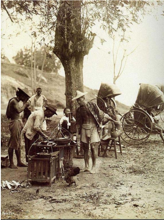
Hình 1: Gánh trà rong ở Quảng Đông

Hầu như đã uống trà thì ai cũng có cách uống riêng của mình, không thể nói ai sành hơn ai. Đối với người Á Đông trà là một sinh hoạt rất phổ thông, vào tiệm ăn thường gia đình nào cũng gọi thêm một ấm trà nóng để làm đồ uống phụ vào bữa chính.