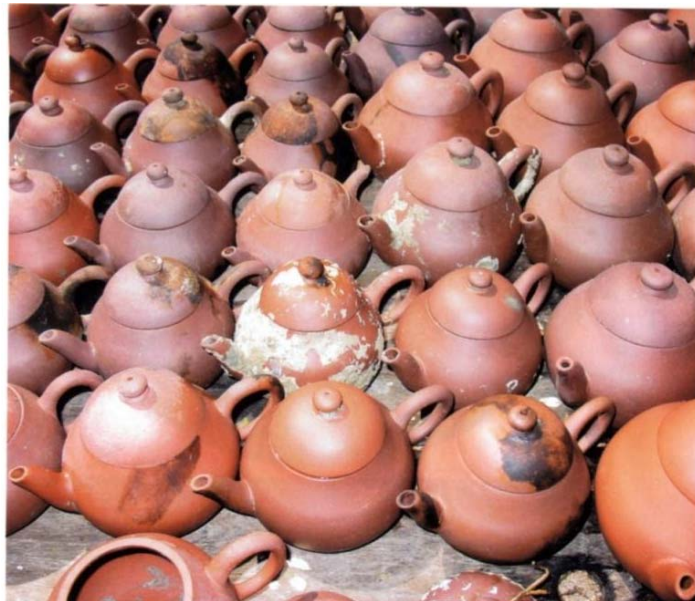
Hình 5: Ấm Nghi Hưng từ thuyền buôn bị đắm

Mỗi người chúng ta có vóc dáng riêng, tiêu chuẩn riêng nên ấm cũng như áo, vừa với người này mà chưa hẳn thích hợp cho người khác. Việc pha trà cũng cần thoải mái nên nếu như ấm có điều bất toàn, trà thủ sẽ không cảm thấy tự nhiên.