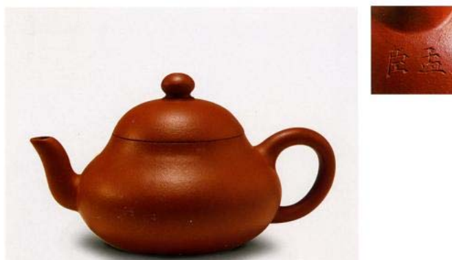
Hình 9: Ấm Mạnh Thần

Về Mạnh Thần, theo chính những hàng chữ viết thì ông sống vào đời Minh Thiên Khải (1621-1627) qua tới đời Sùng Trinh (1628-1644). Ông thường nặn loại ấm nhỏ tròn, khắc chữ bằng dao tre, trong nắp có hai chữ “ Vĩnh Lâm ” bằng chữ triện 6 . Ấm Mạnh Thần chế tạo đa số là ấm chu nê và tử sa, chỉ có rất ít ấm bằng đoạn nê. Các loại ấm cỡ trung và đại cũng hiếm.