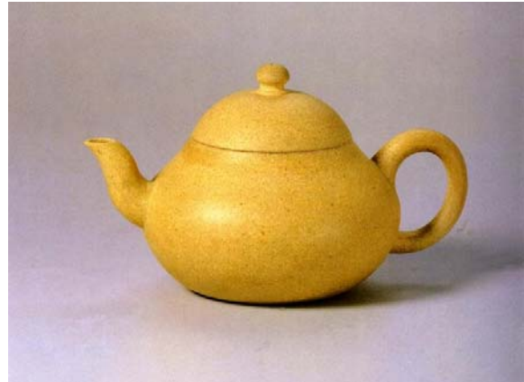
Hình 6: Ấm màu gan gà

Đi sâu hơn, tử sa bao gồm ba loại đất: chu nê [朱泥], đoạn nê [緞泥] và tử sa [紫砂]. Hai màu tím nâu [tử sa] và đỏ [chu nê] thông dụng nhất. Đoạn nê là loại đất màu vàng hơi ngả màu xanh lục. Ấm đỏ ngày nay cũng gọi chung trong tử sa, chu sa hay chu nê chỉ còn để gọi riêng loại đất đỏ thẫm, độ dính cao mà người thợ khéo có thể nặn mỏng như vỏ trứng [egg-shell]. Ấm chu nê dùng một thời gian thì thẫm dần, mỗi khi rót nước nóng vào lại đỏ au lên sinh động chẳng khác gì một con cá lia thia thấy bóng mình trong nước. Có điều đất chu nê đã khai thác hết từ mấy chục năm nay, phần lớn ấm nói là chu nê không phải là đồ thật, ngoại trừ một số danh thủ còn giữ được một số ít để làm những ấm khá đắt tiền.