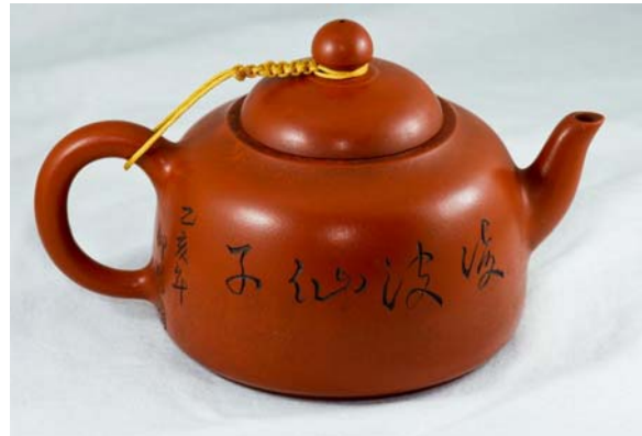
Hình 4: Ấm chu nê

Chu nê theo nghĩa đen là đất màu đỏ mặc dù có người phân biệt ra một loại đất đỏ, màu tươi, độ dính cao chỉ dùng để nặn những ấm vỏ rất mỏng. Ấm chu nê có đặc tính dùng lâu sẽ