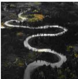
Con sông thiên nhiên