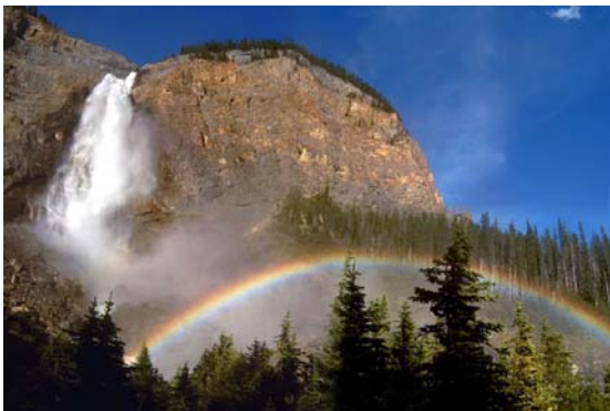
Hình cầu vồng

Tóm lại, các dữ kiện ngôn ngữ trên đều cho ta thấy tương quan long-rồng hay đồng - *kl/trong - sông dựa trên thành phần HT. Không phải ngẫu nhiên mà tiếng Mường có từ long nghĩa là tròn 10 , cũng như tiếng Indônêxia có từ sungai để chỉ sông Đều này chỉ thấy rõ nét khi so sánh