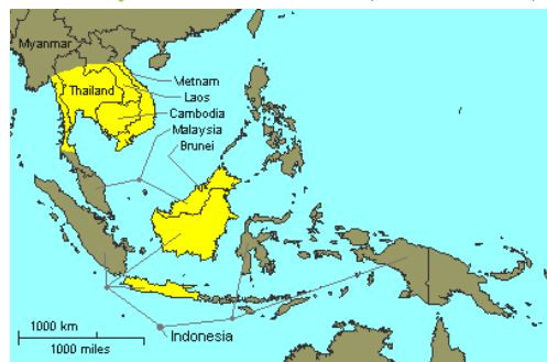
Crocodylus siamensis (sấu Xiêm)