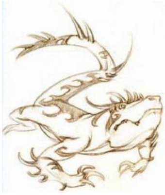
Hình vẽ con hổ giao 虎蛟